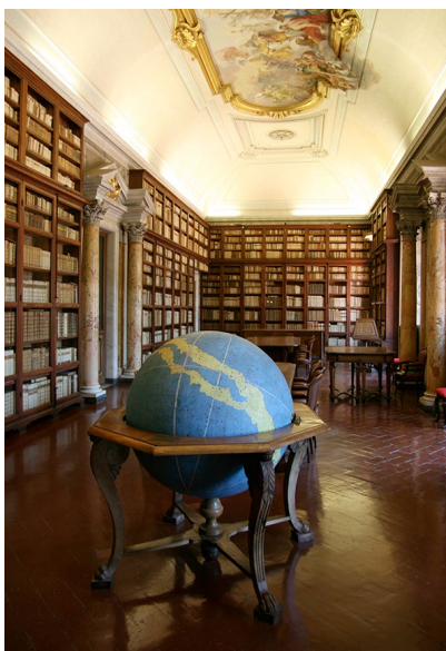
Biblioteca dell'Accademia Nazionale dei Lincei e Corsiniana - Antica sala di lettura

risorse" siano immesse in un circuito integrato e vengano affiancate dalla costituzione di un centro di raccordo ben attrezzato come edificio, risorse e competenze, esse potrebbero diventare un punto di riferimento di rilievo internazionale per la diffusione della conoscenza e del metodo scientifico.