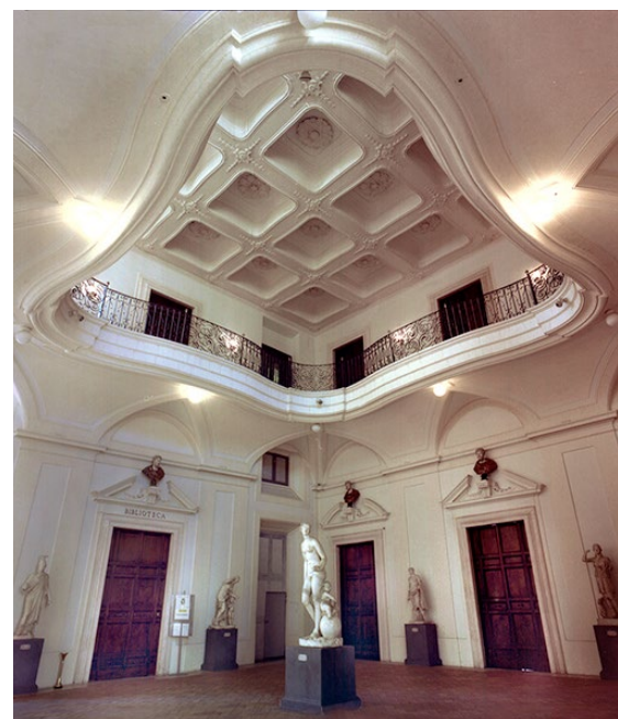
Palazzo Corsini (primo piano) - Roma

Inoltre, l'Accademia prevede l'assegnazione di borse di studio, che a differenza dei premi che coronano una vita di ricerca e di lavoro, premiando scoperte e innovazioni a beneficio dell'umanità intera sono istituite per incoraggiare giovani studiosi a fare ricerca nei vari campi e consentire il perfezionamento della loro preparazione scientifica.