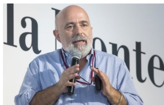
Giorgio Manzi, paleoantropologo, professore ordinario di Antropologia alla Sapienza - Università di Roma